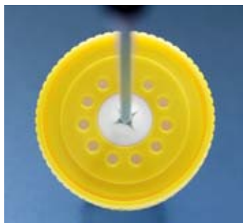
Septum with cross slit for needles <2.1 mm diameter