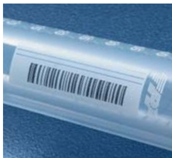
Barcode 128 on tube